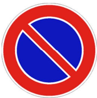
DIVIETO DI SOSTA