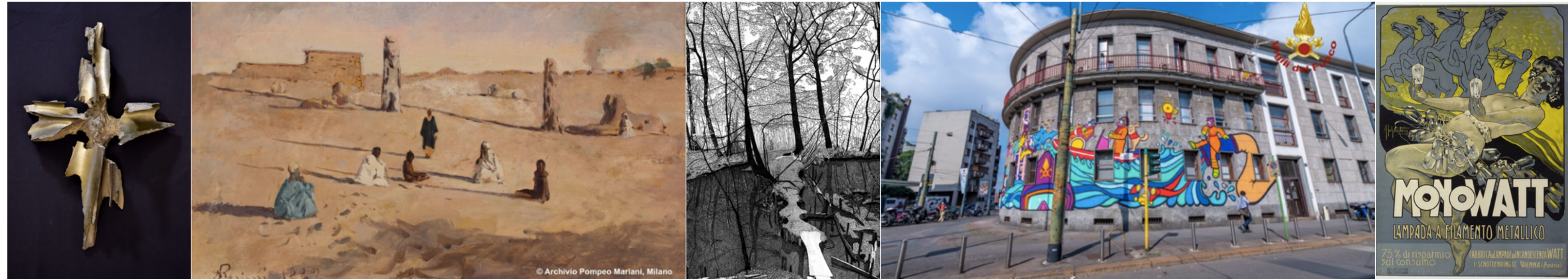
Fondazione Francesco Somaini Scultore - Archivio Mosè Bianchi - Fondazione Federica Galli - Museo Storico dei Vigili del Fuoco di Milano - Musei del Castello Sforzesco | Raccolta Bertarelli