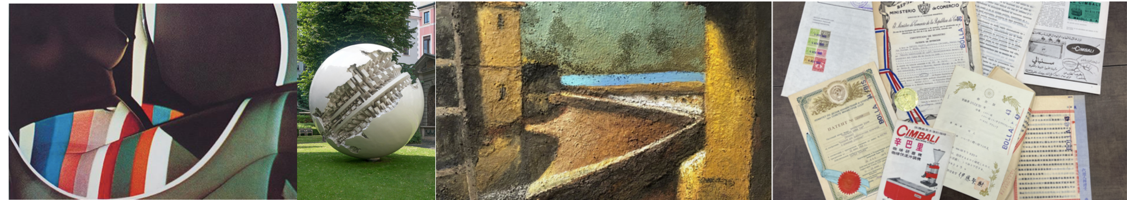
CASVA | Eugenio Carmi - Gallerie d'Italia | Arnaldo Pomodoro - Archivio Rodolfo Monaco - MUMAC | Museo della macchina per caffè di Cimbali Group