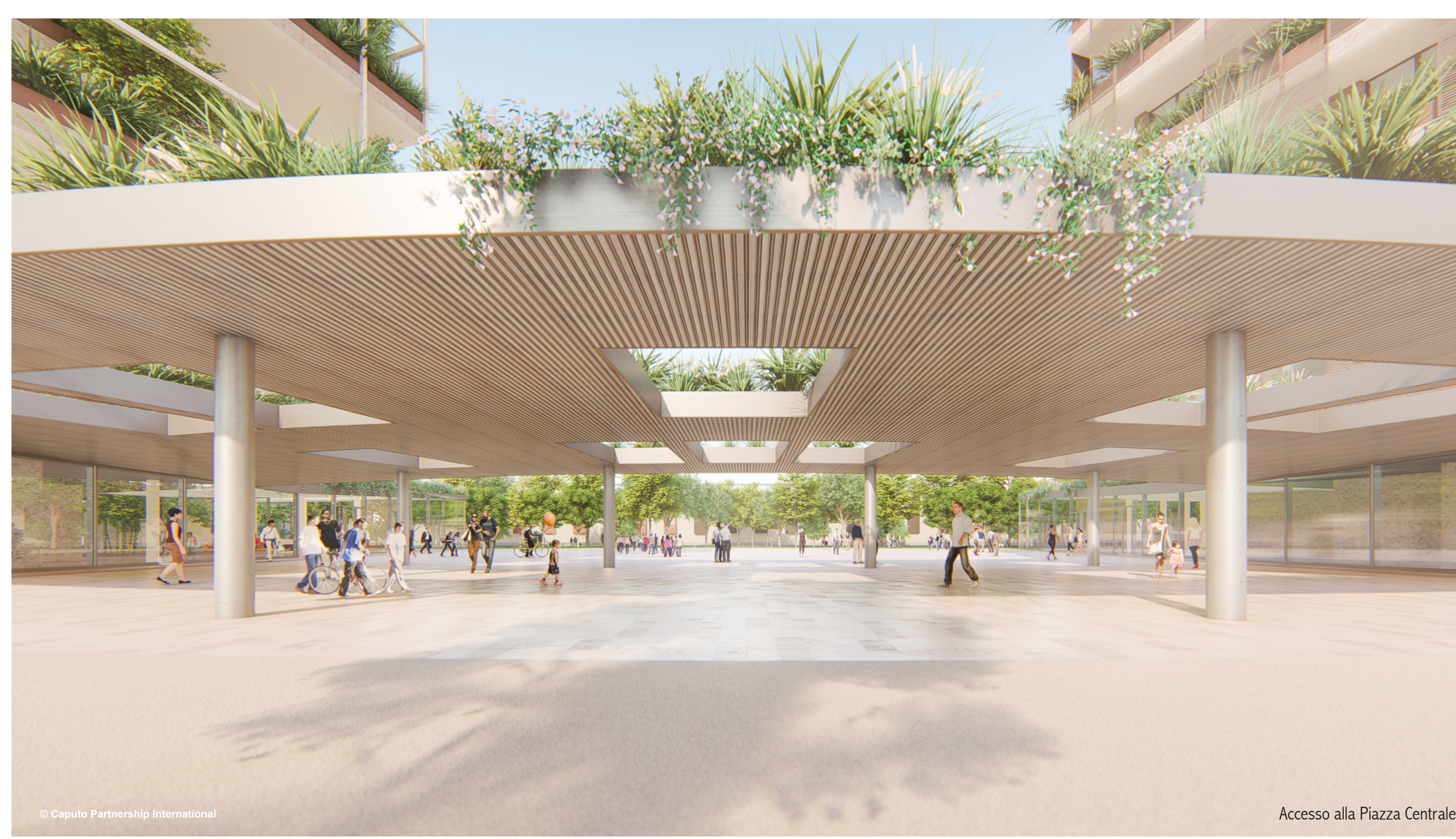
Accesso alla Piazza Centrale