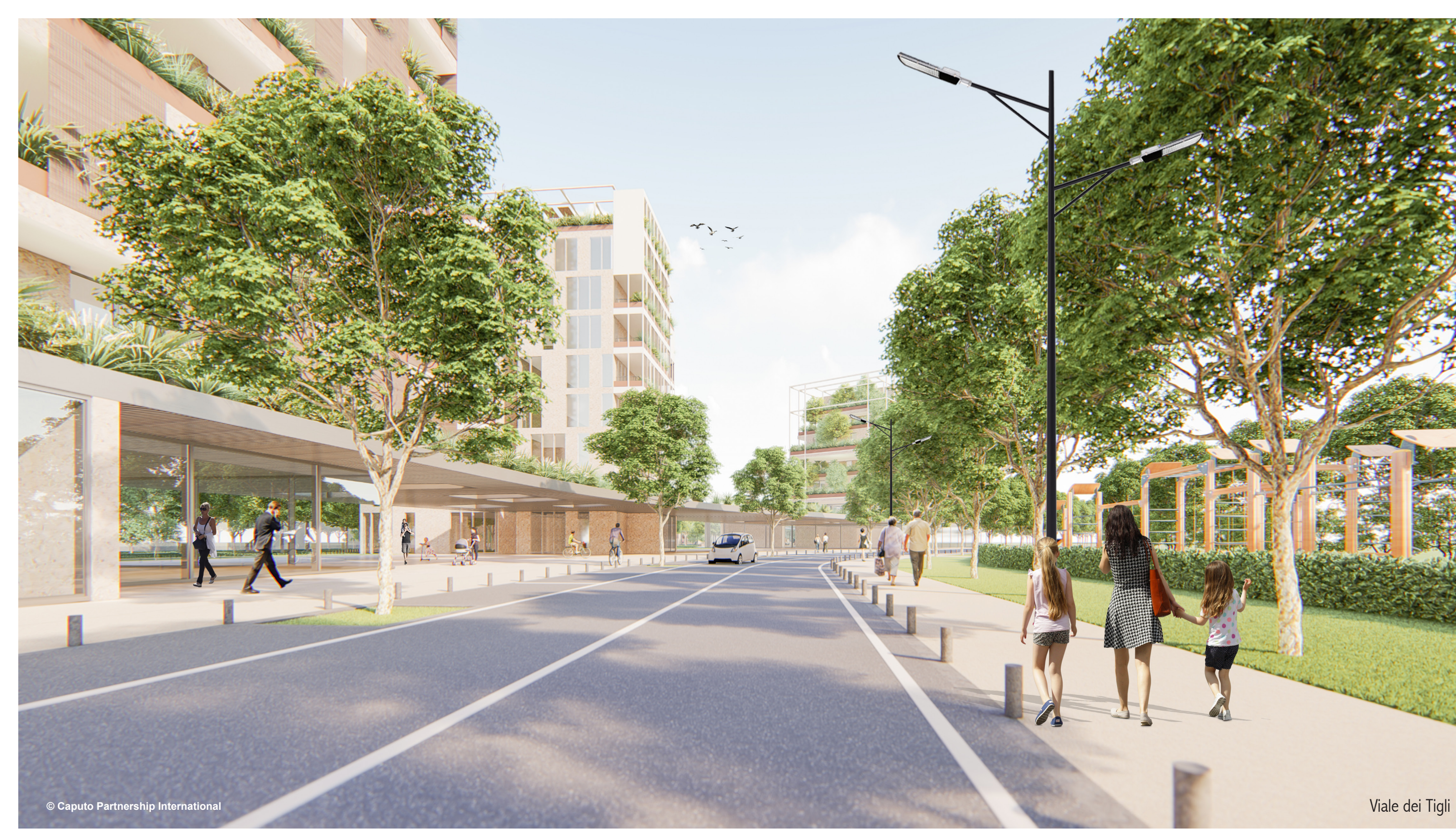
Viale dei Tigli