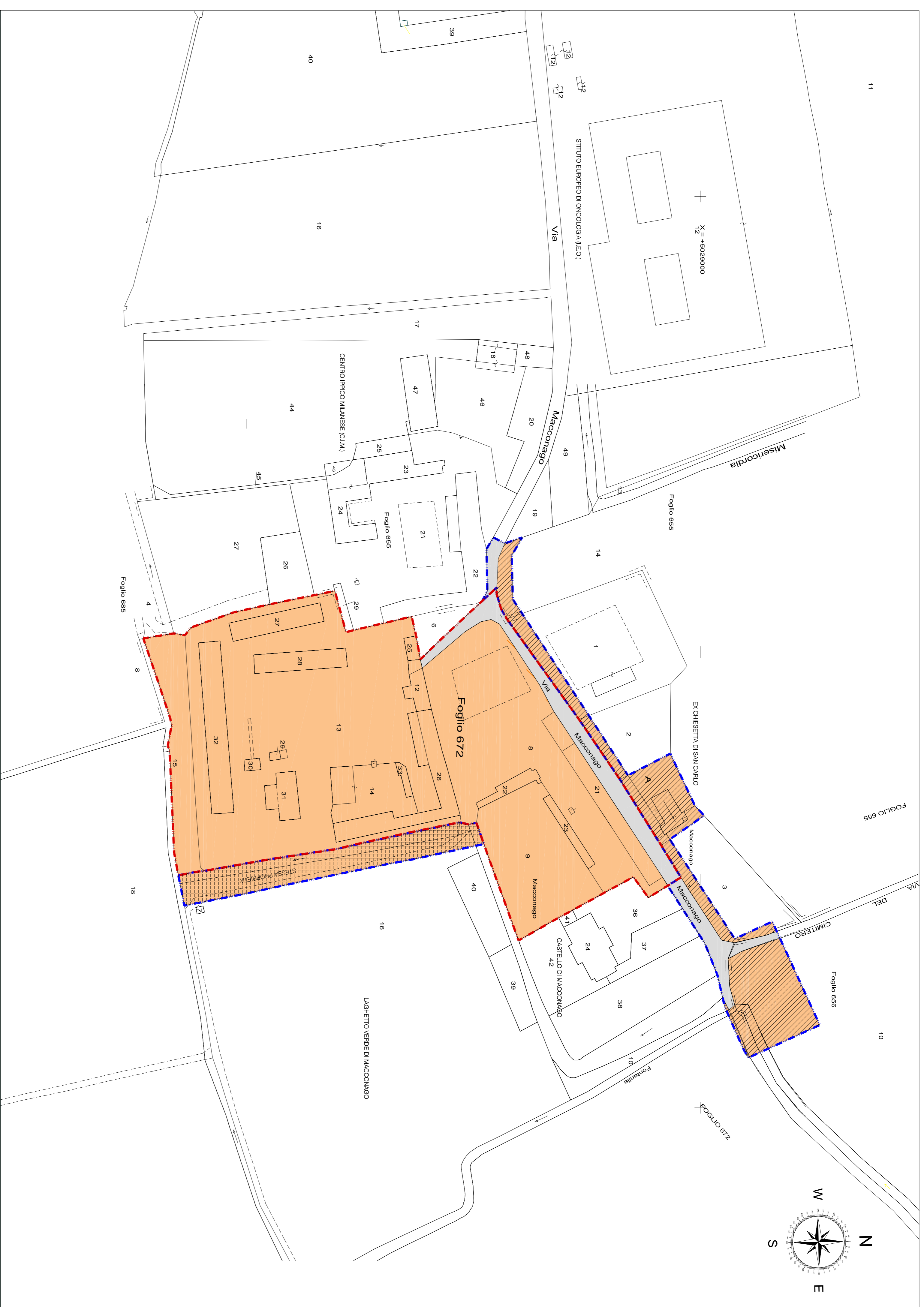
ESTRATTO CATASTALE CON EVIDENZIATE LE AREE INTERESSATE AL P.I.I. E LE AREE FUNZIONALI ALLO STESSO